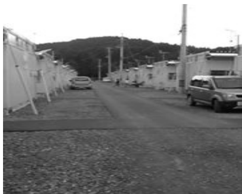
広田水産高校仮設と高台移転地の造成