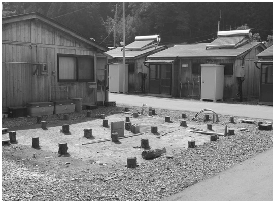
払い下げで解体撤去された敷地（中上団地）