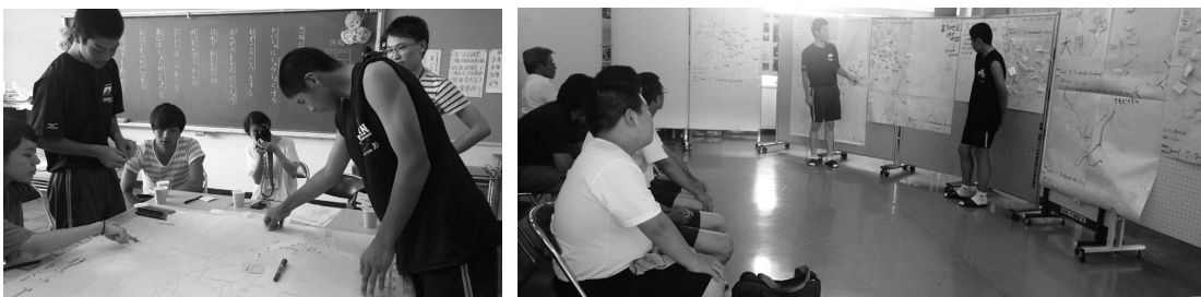
地元中学生たちを集めて開催された第1回広田地区逃げ地図ワークショップ

9月21日には、岩手県沿岸広域振興局の後援も得て第3回目のワークショップが開かれ、広田湾漁協女性部をはじめ地元の女性住民が多数参加し、緊急時の避難のあり方等について話し合いました。一連の成果は年末に報告会を開催して発表する予定です。