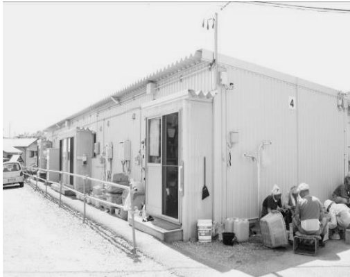
日陰に集まりウニ剥き（要谷第二）