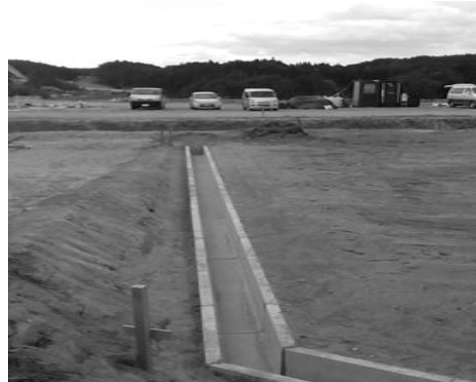
進む広田町の高台移転地の造成