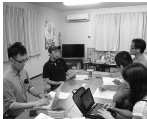
集会所で会長にインタビュー （高田高校仮設）