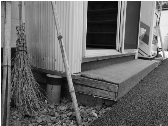
仮設住宅の老朽化が進んでいる（矢作町）