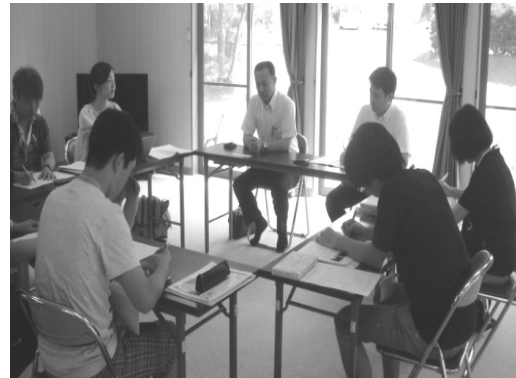
インタビューの様子（モビリア）