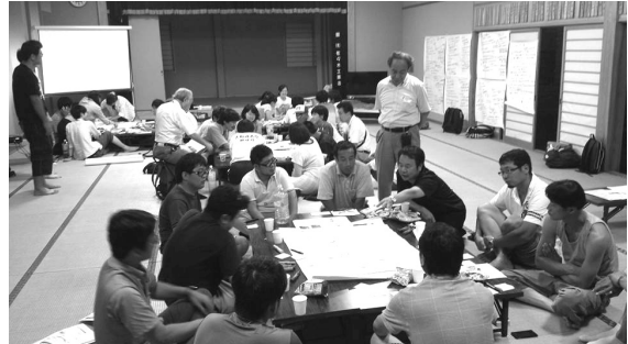
米崎町脇の沢漁港周辺地区まちづくり懇談会 (8月4日、23日)