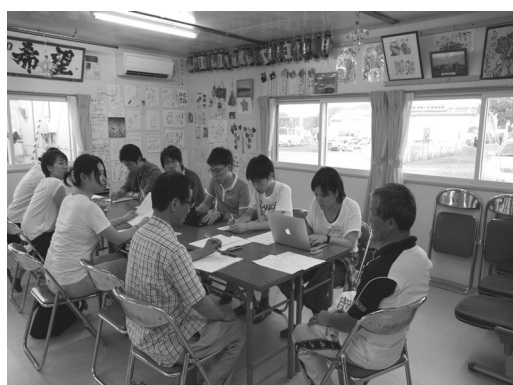
滝の里団地ヒアリング風景