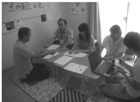
自治会長さんにインタビュー（佐野仮設）