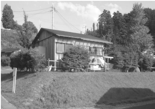
一戸建ての仮設住宅（モビリア）