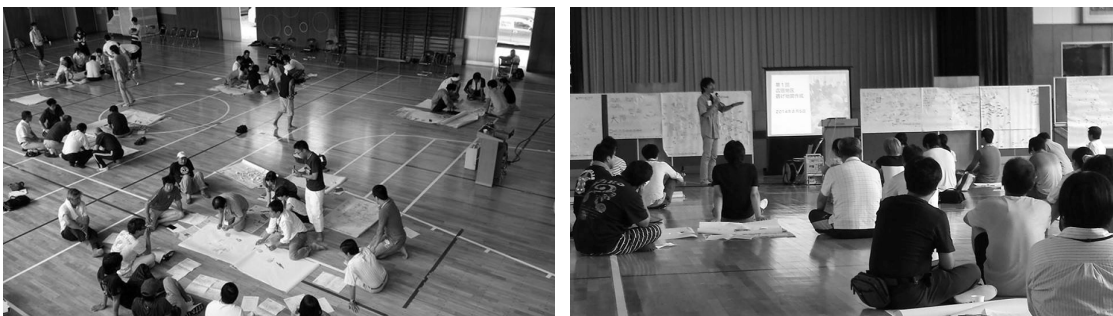
消防団員が20名ほど集まった第2回広田地区逃げ地図ワークショップ(8月24日)