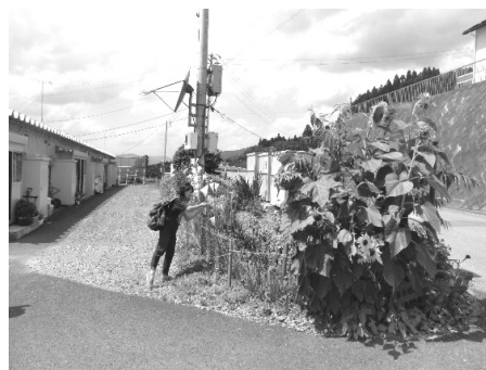
西風道仮設の整備された花壇