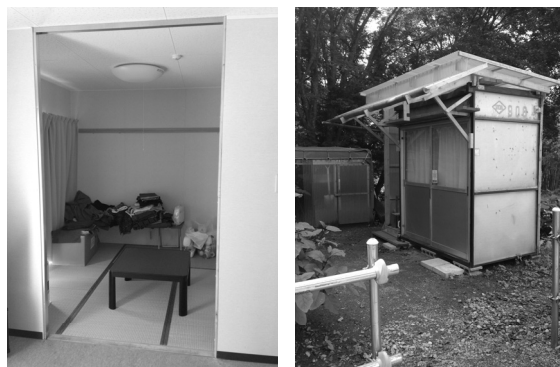
狩集団地の環境変化 (左：集会所、右：団地内倉庫)