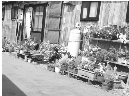
家の前を綺麗に花で飾った住戸（本町）