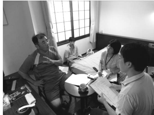
自治会長からホテルで聞き取り（牧田第二）