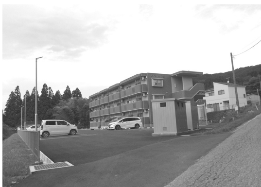
相川団地周辺に建設されたアパート