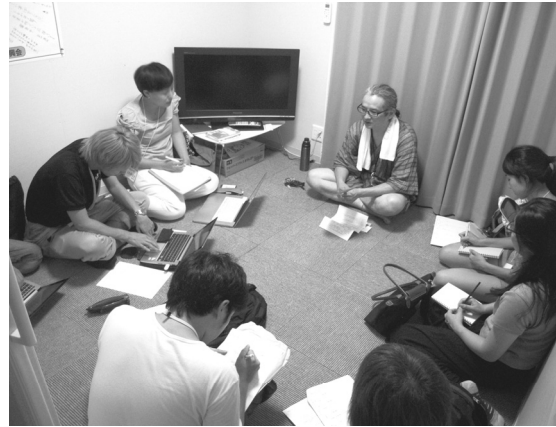
自治会長から仮設住宅内で聞き取り（矢作町）