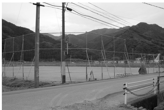
横田小・横田中学校の仮設グラウンド