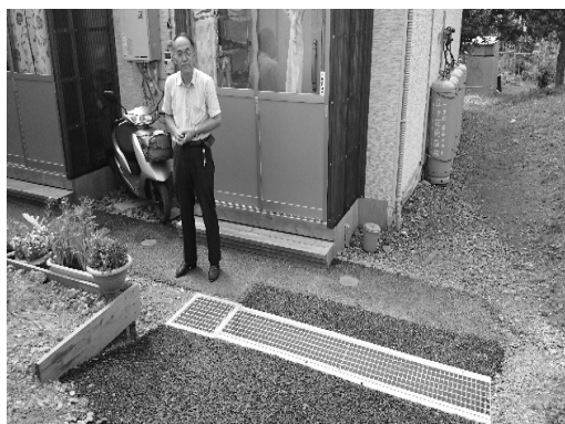
敷地内の水はけ改善のため側溝整備を 市・県に求めた経緯を聞く（西和野仮設）